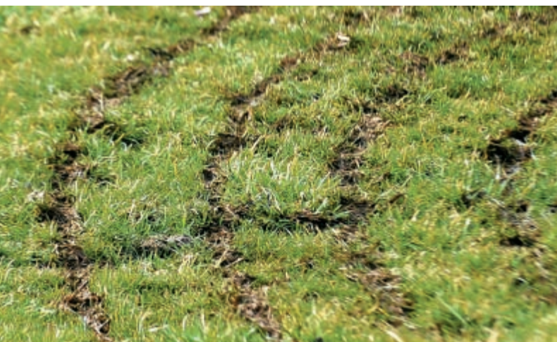
Die von den Schläuchen erzeugten «Strohwürstchen» sind nur dann ein Problem, wenn sie auf, statt zwischen den Gräsern abgelegt werden.